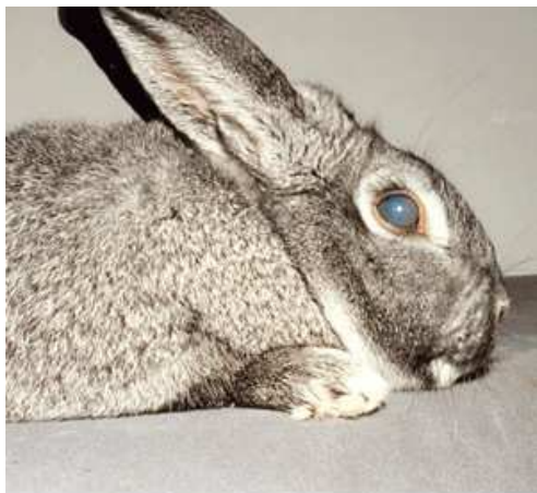
Blindes Kaninchen mit trübem Auge.

Der Nachweis eines Passalurus -Befalls bereitet häufig Schwierigkeiten. Mit den üblichen Labormethoden sind in den Kotproben meistens keine Parasiteneier nachzuweisen, weil diese ja außerhalb des Darms abgelegt werden. Deshalb sollte bei einem Verdacht die Analgegend mit Hilfe eines Tesafilm-Abklatschs nach Eischwürmern und die Kotkugeln auf ausgewachsene Würmer untersucht werden. Eine Behandlung mit Fenbendazol (z. B. Panacur) über fünf Tage hat sich bewährt und sollte nach einem Monat wiederholt werden.