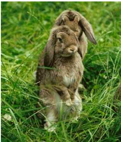
Gesunde Zwergwidder im Auslauf.

Grundlage für einen gesunden Zuchtstamm ist die artgerechte Haltung der Kaninchen. Die genaue Beobachtung der Tiere gibt Aufschluss über den Gesundheitsstatus. Spezifische Symptome einer Krankheit sind nicht immer sofort erkennbar. Deshalb sind Indikatoren wie verminderte oder keine Futteraufnahme sowie geringe oder auch vermehrte Aufnahme von Wasser oft wichtige Anzeichen dafür, dass das Wohlbefinden eines Kaninchens gestört ist.